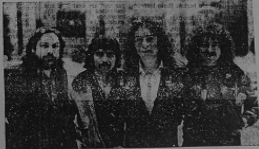
ABOVE: A I I Z, from Bramhall, and RIGHT: Black Sabbath, the group A I I Z support on a big tour.