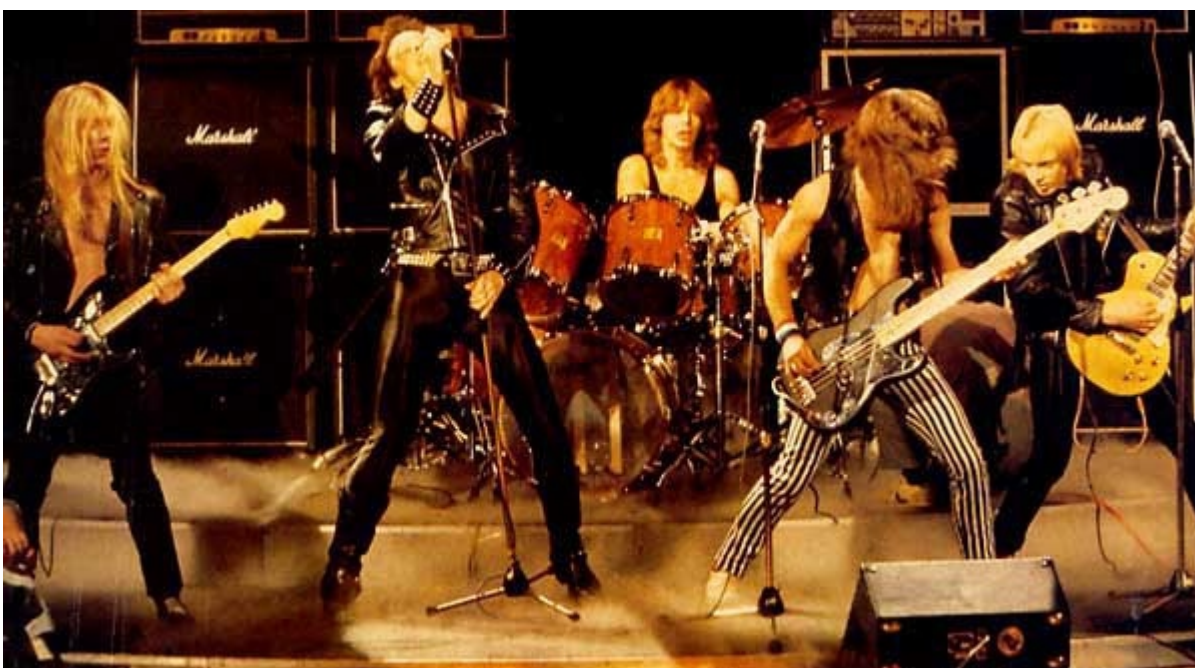
Iron Maiden en 1980

Mientras nos estábamos preparando para ir de gira, estaba cortando las plantillas para que nuestros nuevos casos de vuelo pudieran ser esterilizados con nuestros logotipos y otra información para los roadies para las salidas rápidas de carga, atrapé un nervio de alguna manera presionando hacia abajo en el Stanley Cuchillo por tanto tiempo, no podía mover mis dedos. Llamamos a la dirección y explicó el dilema, enviaron un coche para mí que me llevó a un médico en Bury millas de distancia, y él me inyectó algo y en dos minutos estaba de vuelta a la normalidad, nunca se enteró qué!